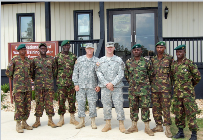
AMERİKALILAR TARAFINDAN EĞİTİLEN KENYALI ASKERLER

Bir tarafta Yemen'deki mücahidler devletleşme eşiğine gelirken, diğer tarafta Cezayir ve Nijerya'da rejimler sallanmaya devam ediyor. İslam ümmetinin öncü fedai kuvveti Küresel Cihad Hareketi dünyanın pek çok bölgesinde devrimleri gerçekleştirmeye başladı. Afrika'daki gelişmeler Suriye ve Orta-doğu ülkelerindeki gelişmelerle birlikte okunduğunda küresel emperyalist kafir devletlerin sonlarının geldiğini söylemek abartı olmasa gerek. Somali'de Şebab Hareketi, zaten Somali'nin yüzde seksenine hakim durumda. Son tahlilde Somali bağımsız bir İslam devletine doğru ilerliyor.